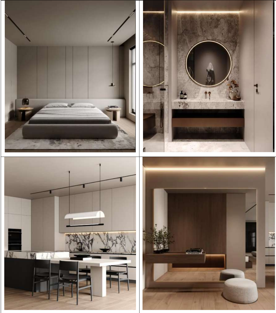
Modern Office Interior – Business Bay, Dubai